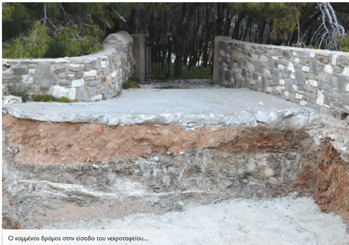
Ο κομμένος δρόμος στην είσοδο του νεκροταφείου...