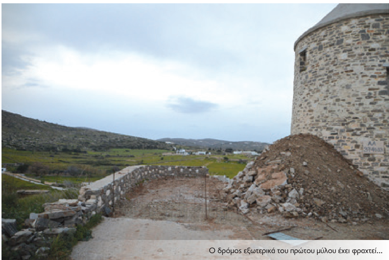
Ο δρόμος εξωτερικά του πρώτου μύλου έχει φραχτεί...

Επίσης, ο προηγούμενος ιδιοκτήτης είχε επενδύσει με μπετόν το μύλο και γκρέμισε τον εσωτερικό τοίχο. Τον είχε σταματήσει, λοιπόν, η αρχαιολογία. Πρόσφατα, σε ενημέρωση του μηχανικού που έχει αναλάβει να χτίζει, μας είπε ότι δεν είναι διατηρητέος ο μύλος. Ρωτήσαμε πότε αποκαταστήθηκε από διατηρητέο μνημείο... ότι θέλει κάνει ο καθένας; Πρέπει να δοθεί μία λύση και άμεσα. Το χωριό έχει έρθει σε μία δύσκολη κατάσταση να μην μπορεί να θάψει έναν νεκρό».