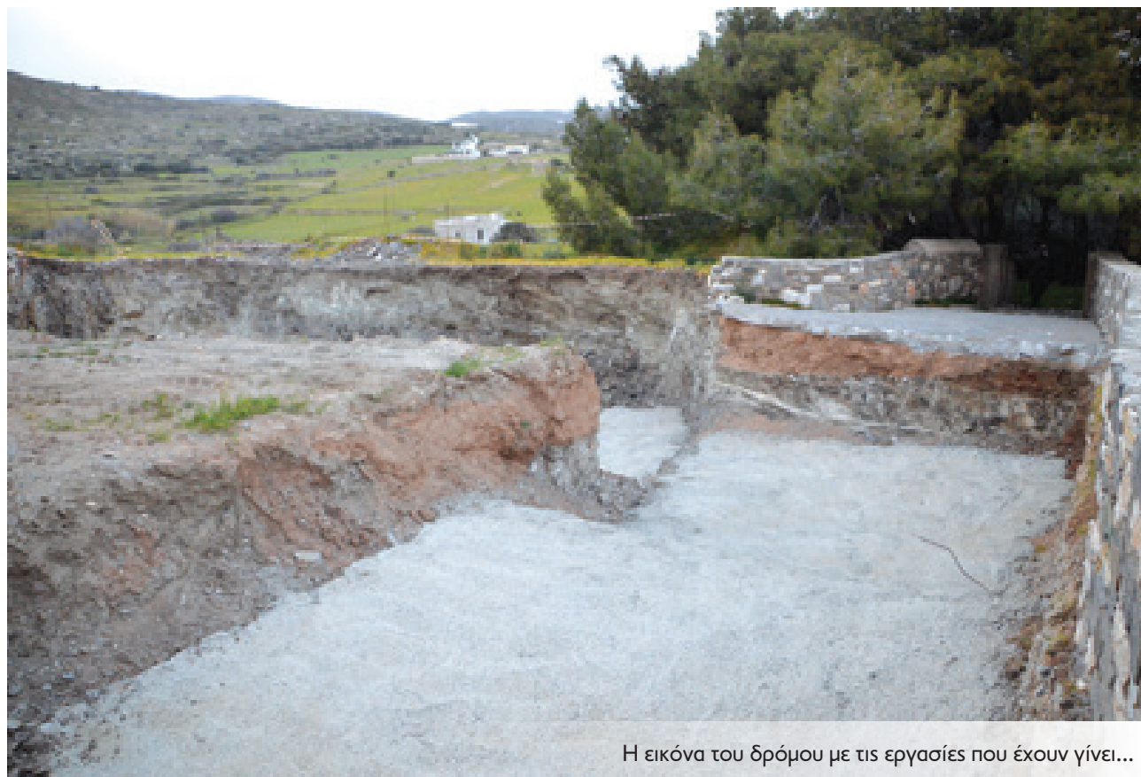
Η εικόνα του δρόμου με τις εργασίες που έχουν γίνει...