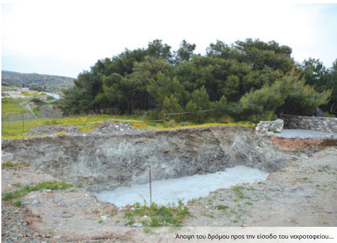
Άποψη του δρόμου προς την είσοδο του νεκροταφείου...

Δεν ξέρω πως θα προχωρήσει το θέμα και τι θα αντιμετωπίσουμε στο μέλλον, αλλά νομίζω ότι όλοι οι τοπικοί άρχοντες θα πρέπει να το σκεφτούν πολύ καλά για τις επόμενες ενέργειες που θα κάνουν. Γιατί θα μας βρούνε απέναντί τους. Το χωριό έχει ήδη ξεσηκωθεί για πολλούς και διαφόρους λόγους και ο βασικότερος είναι αυτός που σας ανέφερα».