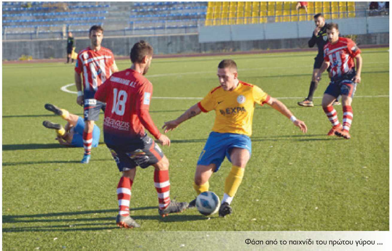
Φάση από το παιχνίδι του πρώτου γύρου ...