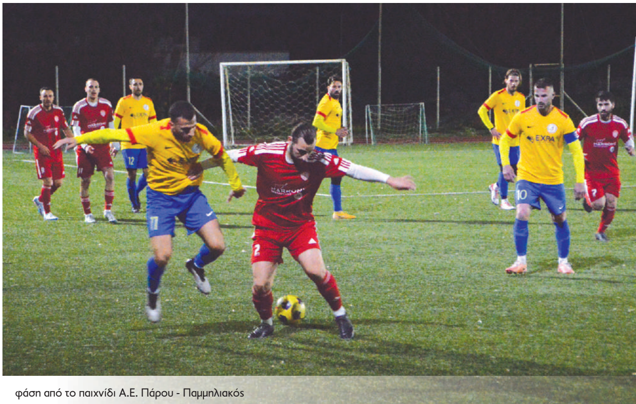
φάση από το παιχνίδι Α.Ε. Πάρου - Παμμηλιακός