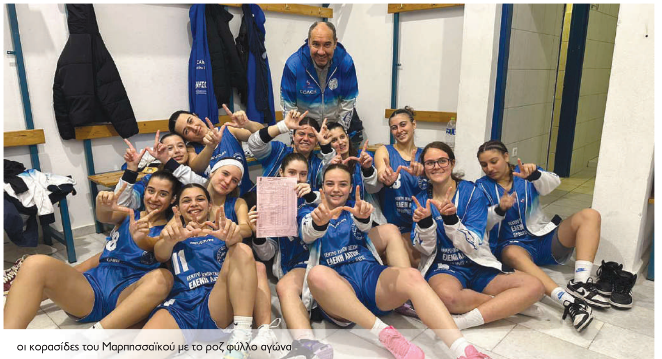
οι κορασίδες του Μαρπησσαϊκού με το ροζ φύλλο αγώνα