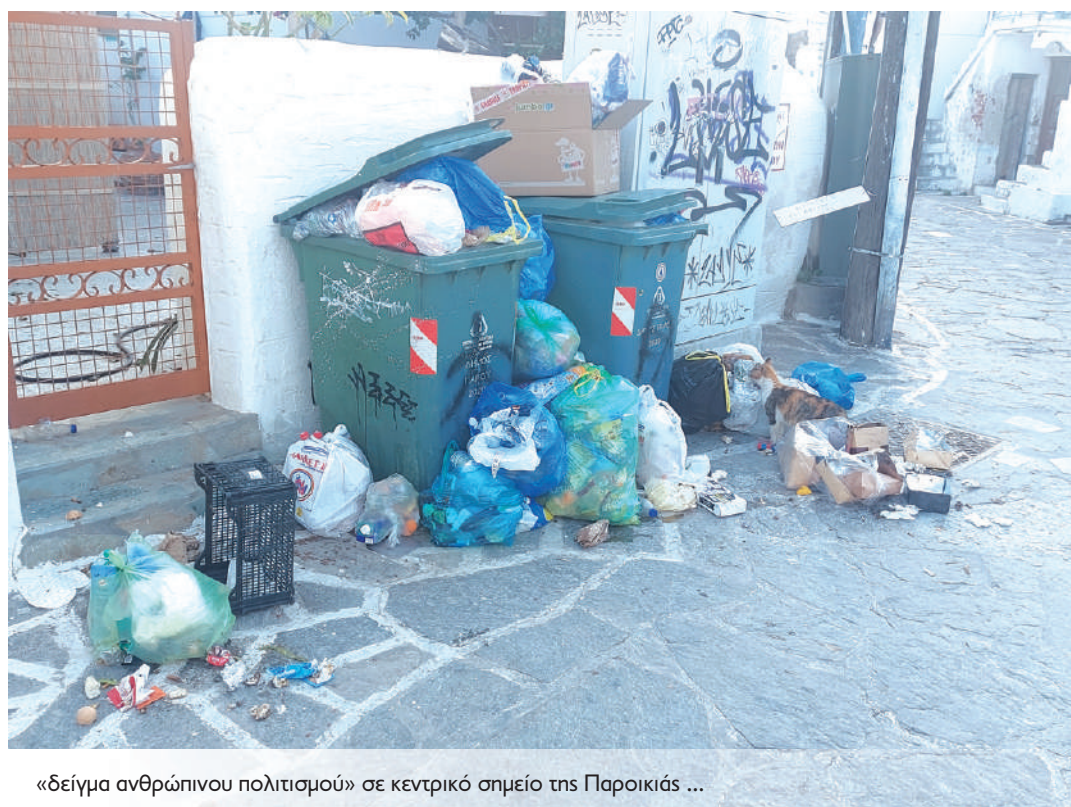
«δείγμα ανθρώπινου πολιτισμού» σε κεντρικό σημείο της Παροικιάς ...

✓ Κλείνουμε λοιπόν και για σήμερα, χωρίς νέα από δημοτικό συμβούλιο Πάρου αυτή τη φορά... Όχι ότι δεν έχουμε, αλλά ξέρουμε να τα αξιοποιούμε σωστά και στην ώρα τους! «Κάτι» περιμένατε κι από εκεί, αλλά υπομονή δεν αργεί η άλλη ή η μεθεπόμενη εβδομάδα. Εξάλλου «προβλέψαμε» σωστά στην στήλη του περασμένου φύλλου, ότι θα γίνει συμβούλιο την Τετάρτη (προχθές). Άντε και καλές Απόκριες να έχουμε, με υγεία πάνω απ' όλα αλλά και μυαλό!