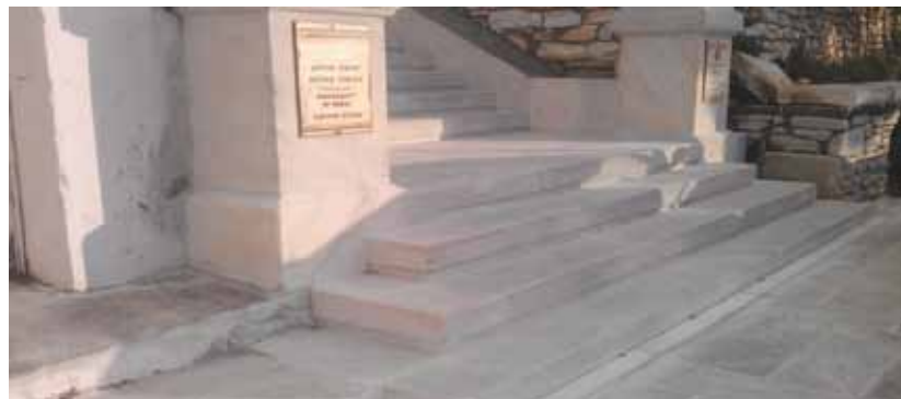
Άλλαξε η εικόνα του Κοινοτικού Μεγάρου στις Λεύκες. Ολοκληρώθηκαν οι εργασίες αποκατάστασης των σκαλοπατιών και το αποτέλεσμα είναι εκπληκτικό!

Η πρώτη συνάντηση θα πραγματοποιηθεί την Κυριακή 2 Δεκεμβρίου, 11-2μ.μ. στο χώρο του Κέντρου Πρόληψης «Θησέας Κυκλάδων». Για περισσότερες πληροφορίες και δηλώσεις συμμετοχών επικοινωνήστε στο τηλέφωνο: 22840 24745 ή με mail: thiseasp@otenet.gr.