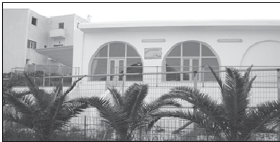
Επάνω σε επικίνδυνη στροφή βρίσκεται το νηπιαγωγείο

Στο Δρυό, ο παραλιακός δρόμος εδώ και πάρα πολλά χρόνια έχει ...πέσει. Είναι ο δρόμος που ενώνει την παραλία του Δρυού με το Πυργάκι. Έχουν γίνει μελέτες, έχουν εγκριθεί, όμως και πάλι δεν εκτελείται το έργο, εξ αιτίας