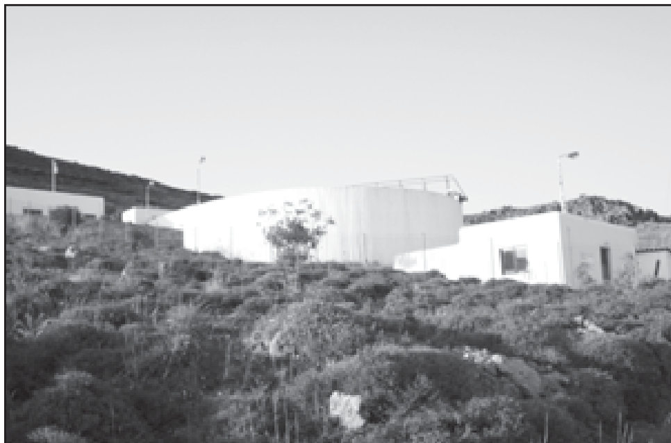
Οι εγκαταστάσεις του Βιολογικού Καθαρισμού στη Μάρπησσα

Ασχολείται το Δημοτικό Συμβούλιο. Δηλαδή αυτό αποφασίζει για τα ζητήματα του κάθε τοπικού διαμερίσματος.