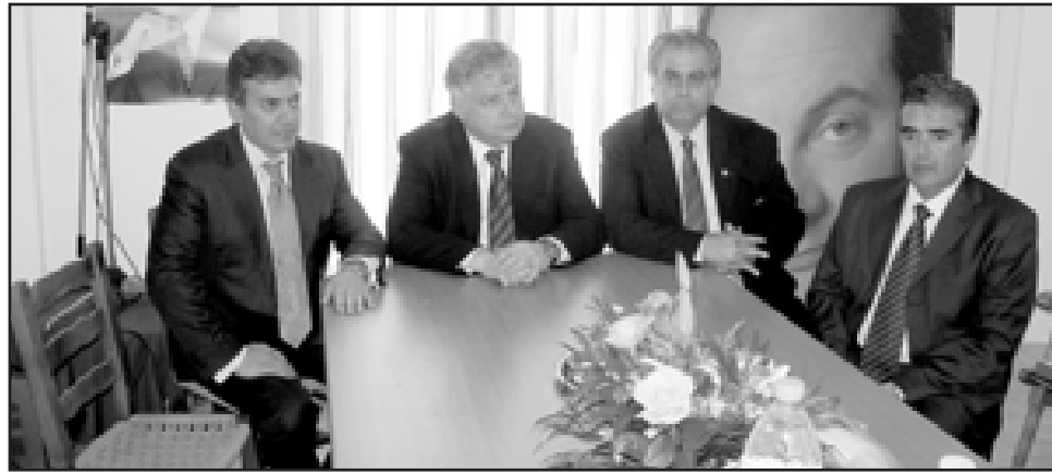
Ο υφυπουργός Υγείας Γ. Κωνσταντόπουλος, ο βουλευτής Γ. Βρούτσης, ο επικεφαλής της μειοψηφίας στο Δ.Σ Λοΐζος Κοντός και ο Πρόεδρος της Τ.Ο. της Ν.Δ. Χ. Μαλινδρέτος

Ο υφυπουργός, επισκέφθηκε το Κ.Υ. Πάρου και άκουσε, όπως είπε, το αίτημα της τοπικής κοινωνίας, μέσω του αντιπροσώπου της, βουλευτή Κυκλάδων της Ν.Δ., Γιάννη Βρούτση, για τη δημιουργία νέου