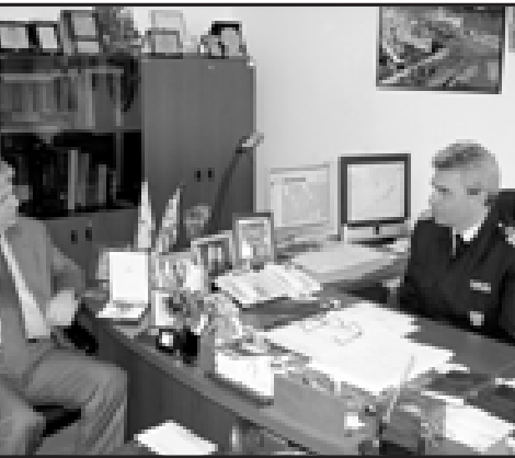
Από την επίσκεψη του κ. Κωνσταντόπουλου στο Κέντρο Υγείας και στο Λιμεναρχείο

«Ο Υφυπουργός ανταποκρίθηκε σε ένα ζήτημα που του μετέφερα και που εκφράζει το λαό της Πάρου. Βλέπουμε ότι πραγματικά ανοίγεται μια μεγάλη και σημαντική ευκαιρία και αν τηρηθούν οι προϋποθέσεις, η Πάρος θα αποκτήσει το δικό της Κέντρο Υγείας - Νοσοκομείο».