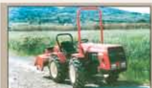
Πωλείται. Τηλ. 6974357009