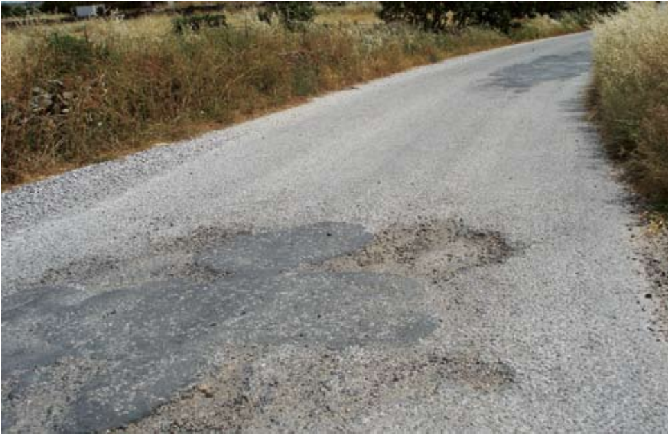
Πριν από περίπου δύο μήνες ο Δήμος έκλεισε τις λακούβες στο δρόμο προς Καμάρες. Οι λακούβες όμως ξανάνοιξαν και χάσκουν ορθάνοιχτες, απειλή για τα αυτοκίνητα και τους οδηγούς τους.