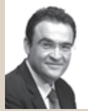
του Σταμάτη Μαύρου

Ντόμπνερ, με τα όργανα του παιδιού τους -καρδιά και συκώτι- έδωσαν ζωή σε δύο κοριτσάκια στην Αγγλία.