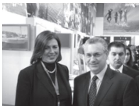
Η πρόεδρος του ΗΑΓΤΑ Άργυρώ Φίλλη με τον Υπουργό Τουριστικής Ανάπτυξης κ. Μακρόπουλο και το Γ.Γ. του ΕΟΤ κ. Κοφίνη